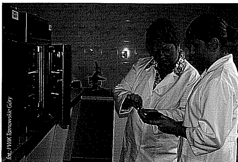
Spółka uzyskała akredytację dla laboratorium wg normy PN-EN ISO/IEC 17025