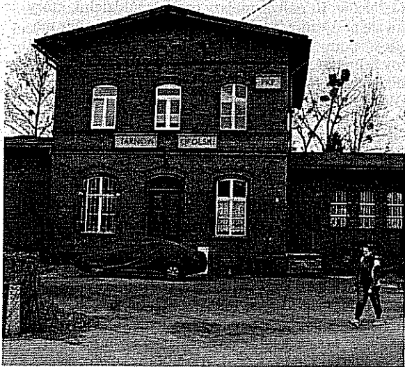
Może jeszcze w tym roku gmina przejmie budynek dworca.

TARNÓW OPOLSKI. Kolej pozbędzie się kosztownego balastu, a urząd zyska duży lokal.